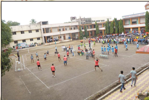
सोलापूर विद्यापीठ, सोलापूर आंतरमहाविद्यालयीन व्हॉलीबॉल स्पर्धेतील एक क्षण