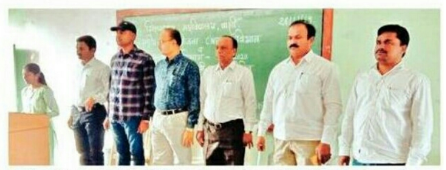
बार्शी : संविधानाच्या प्रास्ताविकेचे वाचन करताना उपस्थित शिक्षक.