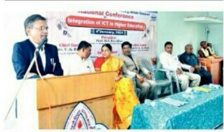
वार्शी : एकदिवसीय राष्ट्रीय परिषदेच्या कार्यक्रमात मार्गदर्शन करताना डॉ.